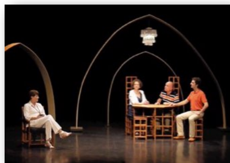
Château de Quatre