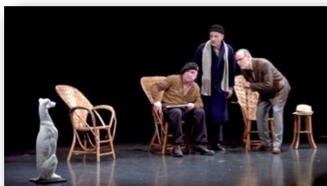
Le Vent des Peupliers